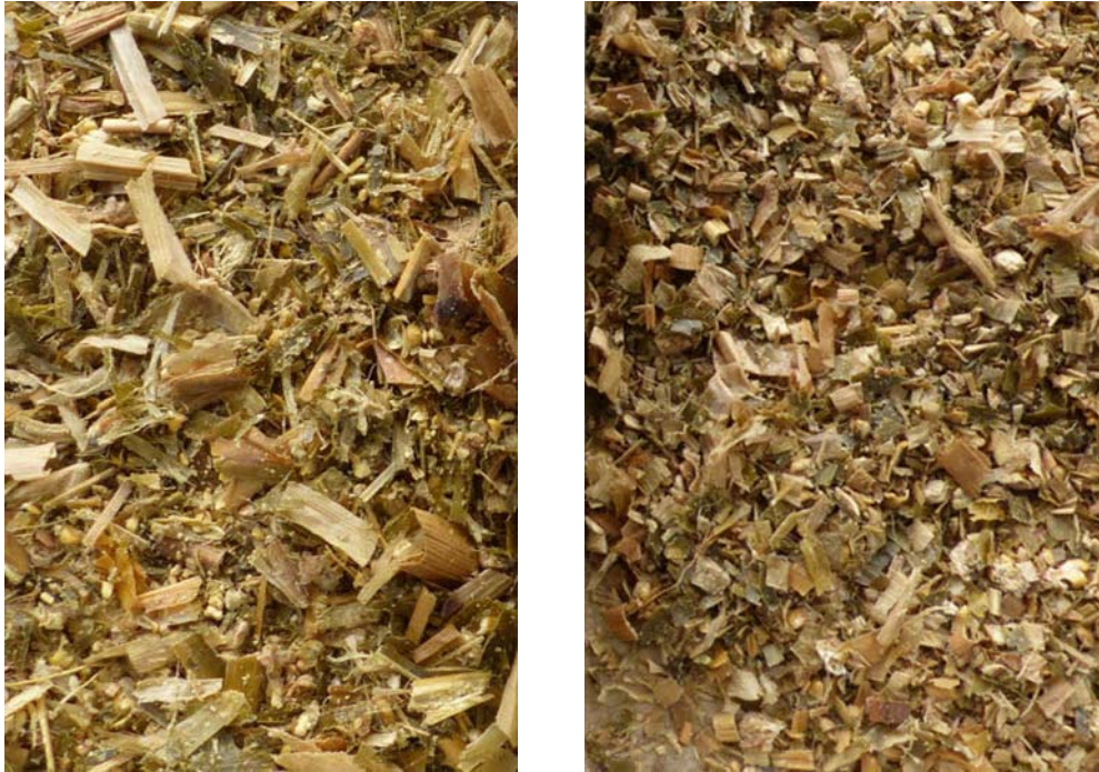
Snijmaïs gehakseld met shredlage techniek (links) en op traditionele haksellengte (rechts)

Shredlage-hakselen is een hakseltechniek waarbij de maïs ten opzichte van de standaard hakselmethode op een grotere lengte van 25-30 mm wordt gehakseld en daarnaast intensiever wordt gekneusd. De intensievere kneuzing wordt vooral bewerkstelligd door een groter verschil in toerental tussen de kneusrollen en daarnaast door een aangepast profiel op de kneusrollen (zie ook hoofdstuk Voeding paragraaf 12.3)