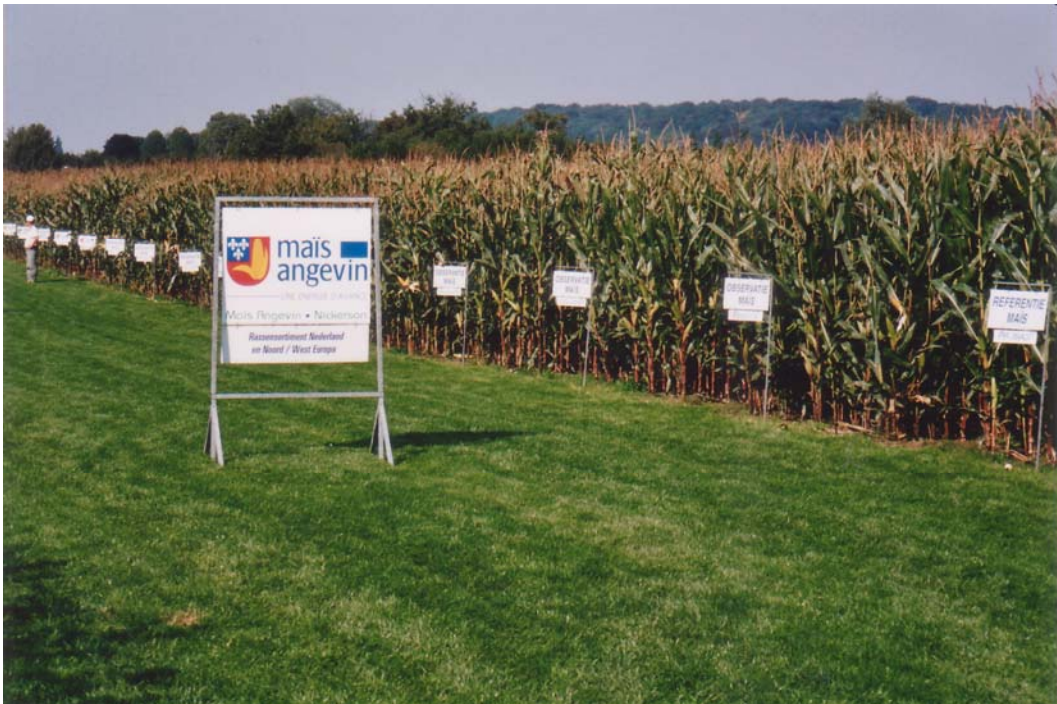
Steeds vroegere oogst door vroegere rassen

Het optimale oogsttijdstip van snijmaïs is het moment waarop het gewas de maximaal benutbare voederwaarde-opbrengst bereikt. In theorie wordt dat bereikt bij een combinatie van de maximale voederwaarde-opbrengst op het veld, minimale inkuilverliezen in de kuil en de hoogste benutting door het vee. In de praktijk hoeven deze factoren niet op hetzelfde moment of bij hetzelfde drogestofgehalte te vallen. Het beste oogstmoment is een compromis. Het rastype heeft hierop geen invloed (zie ook paragraaf 10.1.4). Het beste compromis wordt bereikt als de snijmaïs een drogestofgehalte heeft van 36 % op het veld. De kolf heeft dan een drogestofgehalte tussen 55 à 60 % en het gewas tussen 24 en 27%. Dit drogestofgehalte van het gewas wordt veelal gerealiseerd als de helft tot een kwart van de bladeren nog groen zijn. Tot slot hebben ook de oogstbaarheid (stengelrot en legering) en de bereikbaarheid van het perceel invloed op het optimale oogsttijdstip.