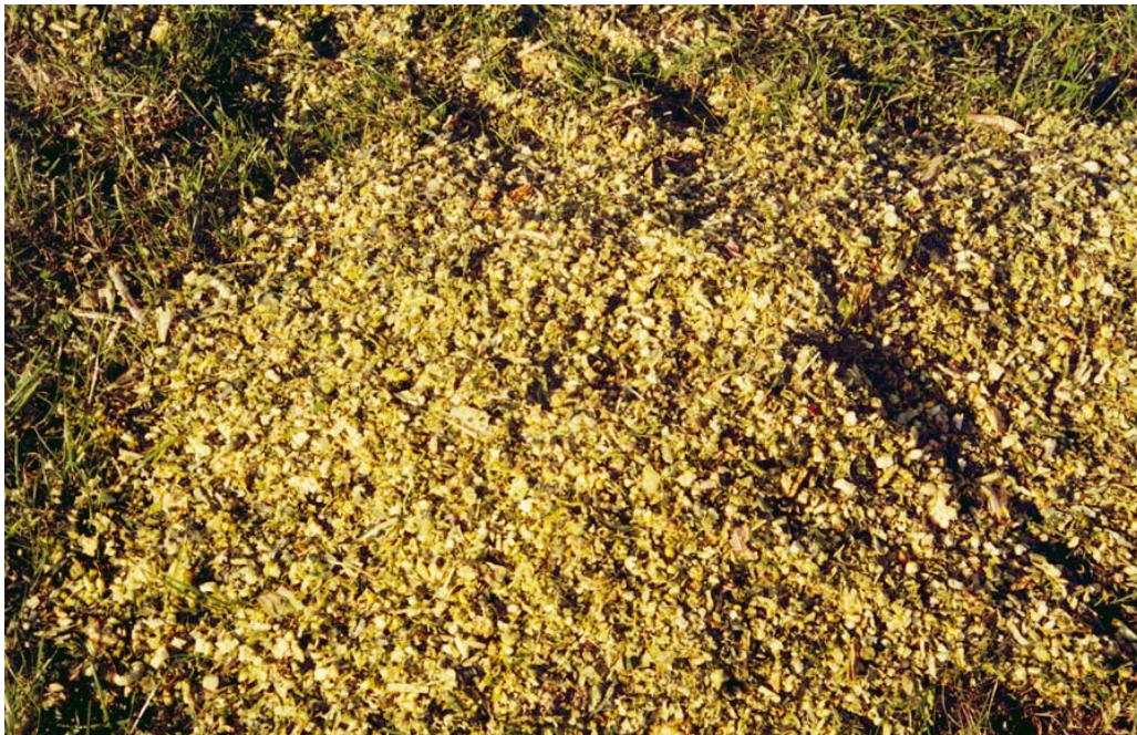
Beoordeel de haksellengte tijdens het hakselen

Onvoldoende scherpe messen en een slechte afstelling van de messen geven een onregelmatig gehakseld product. U kunt daarom het beste tijdens het hakselen een aantal keren de haksellengte en hakselkwaliteit controleren op de kuil. De lengte kan men controleren door de lengte van een aantal haaks doorgesneden stengeldelen te meten. Een slechte hakselkwaliteit uit zich in eerste instantie in lange rafelige delen droge stengel- en schutbladeren.