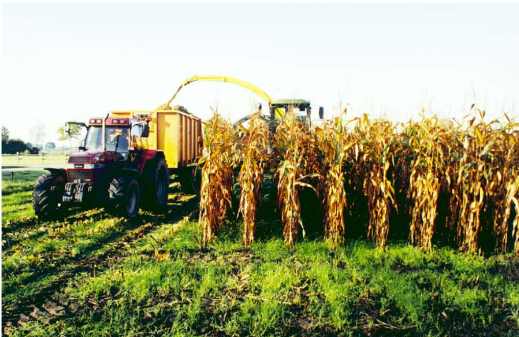
Verdroogde maïs heeft vaak een lager ds-gehalte

Bij vroeg in de herfst optredende nachtvorst kan het proces van afrijping abrupt worden afgebroken. Doordat de cellen kapot vriezen vindt er geen transport van water en koolhydraten in de plant meer plaats waardoor het gewas zeer langzaam indroogt. Bevroren gewassen zijn bovendien gevoelig voor stengelrotaantasting en kunnen dan ook maar beter, afhankelijk van mate van vorstschade en tijdstip waarop deze optreedt, zo snel mogelijk worden geoogst.