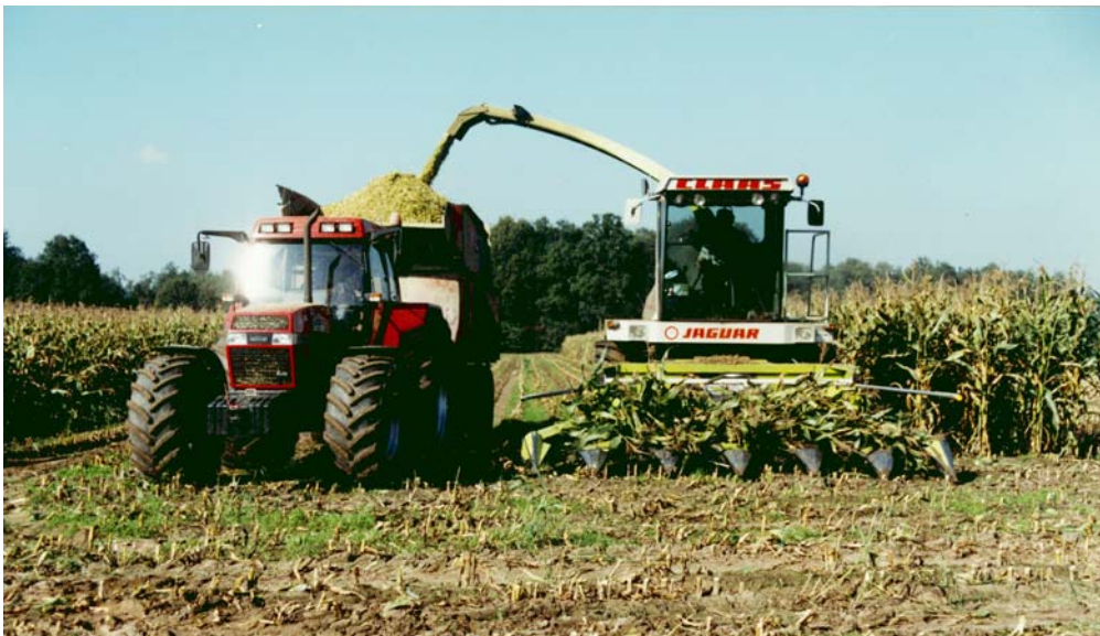
Optimaal oogststadium ligt bij 36% drogestof

In extreme situaties, waarbij de maïs een onvoldoende hoog drogestofgehalte kan bereiken, is het noodzakelijk in ieder geval te streven naar een drogestofgehalte van 28%. De inkuilverliezen blijven dan beperkt tot 10%.